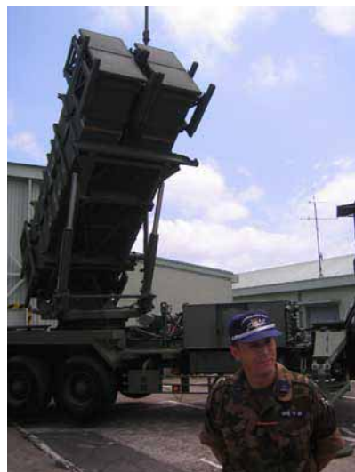
パトリオットシステム 垂直発射装置