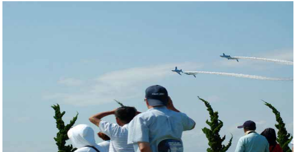
ブルーインパルスのデモ