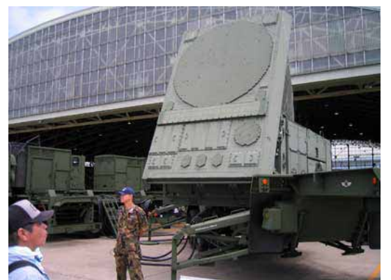
レダー装置と奥は発電ユニット