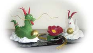
今年の干支 JH1QHE 作