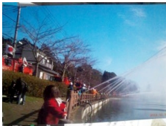
8日出初め JG1VBD 八鶴湖