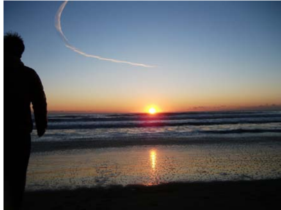
白里海岸の初日の出 JG1HEJ