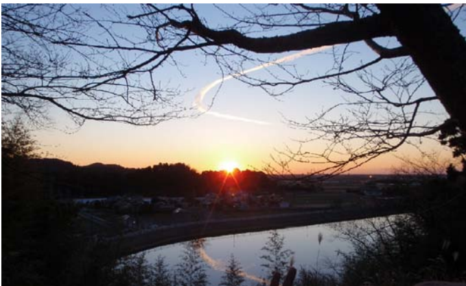
雄蛇ヶ池山頂より初日の出 JI1BVB

これからも、会員各位が心身ともに健康で趣味の王様であるアマチュア無線が何時までも続けられることを祈念いたしまして、クラブの益々の発展と会員の皆様方はじめ、ご家族の方々のご健康とご多幸を心よりお祈り申し上げ、年頭のご挨拶といたします。