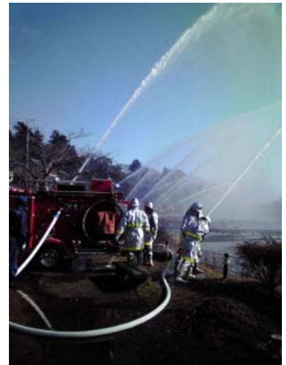
1月9日 八鶴湖 出初式