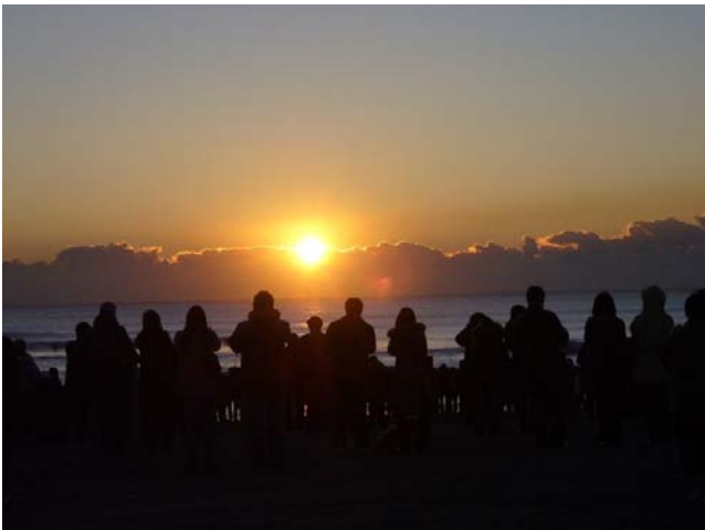
白里海岸にて JG1HEJ 杉崎