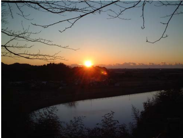
雄蛇ヶ池より JI1BVB 石川