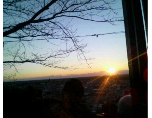
山王台公園より JG1VBD 石井