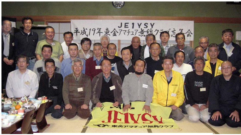
12月1日 JE1YSY忘年会 於：南風荘